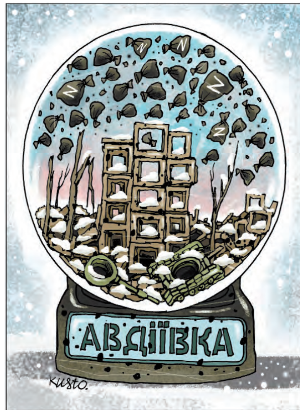
Авдіївка. Куля з чорним снігом.