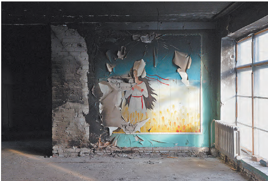
Зруйнована під час окупації школа в селі Рудницьке Броварського району на Київщині.

Олександра КЛИМЕНКА. Більше фото тут — www.golos.com.ua