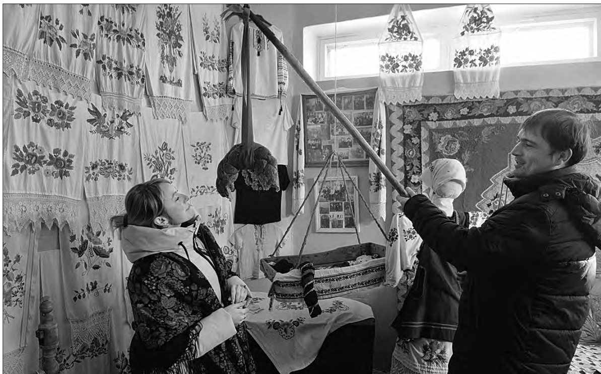
Завсідники клубу відтворили старовинний обряд «кусання калити».