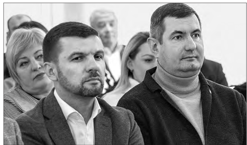
Народний депутат України Ігор Гузь (ліворуч) та голова Волинської обласної ради Григорій Недопад уважно слухали виступи промовців на врочистій академії. Їхні зауваження і пропозиції врахують у подальшій роботі.

Микола ЯКИМЕНКО. Фото з сайту Волинської обласної ради.