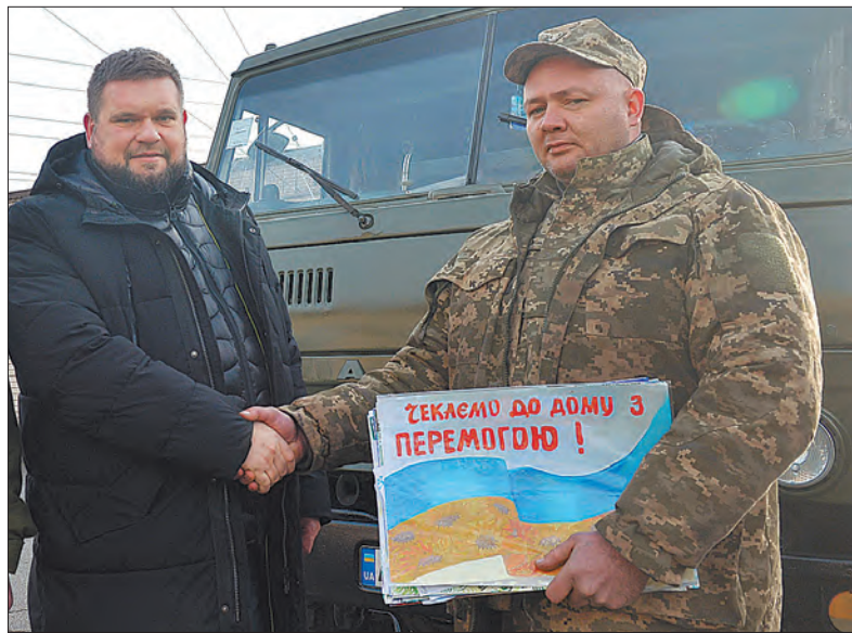
Солдат «Морфей», народний депутат України Андрій Ключко.

Створити такий комплекс стало можливим завдяки тісній співпраці волонтерів та Благодійного фонду «Громадська ініціатива мешканців Кривба-