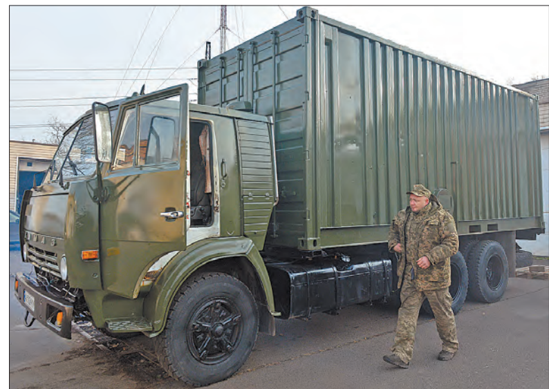
Такий вигляд зовні має мобільний лазне-пральний комплекс.