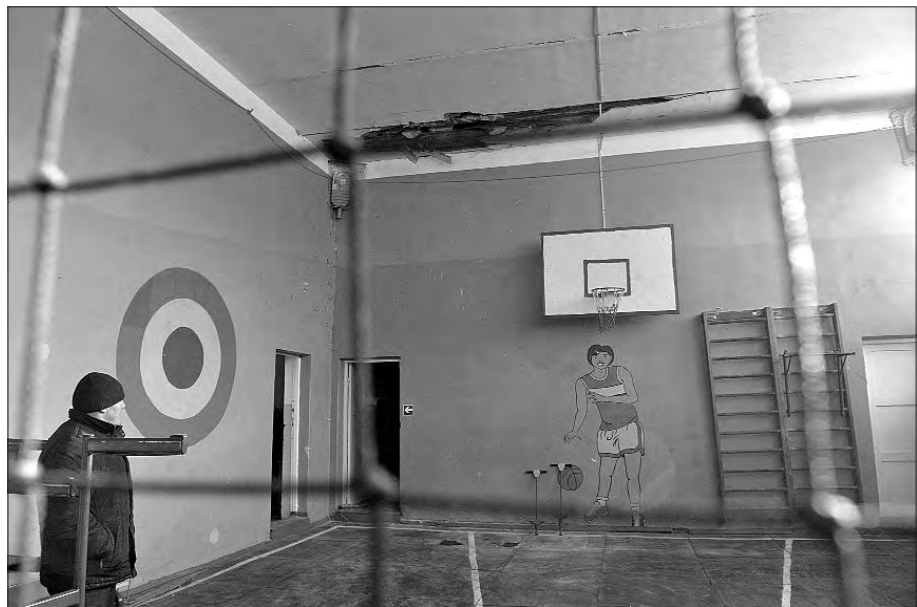
На стелі спортзалу чітко видно слід від «прильоту».

Добірку підготувала наш власкор на Рівненщині Олександра ЮРКОВА.